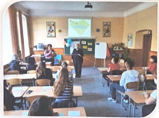
школа спокою для батьків