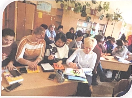
школа творчості для вчителів